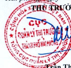
Trần Thành Vin